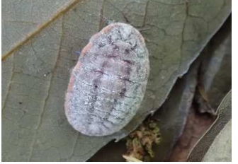
イチモンジカメノコハムシ