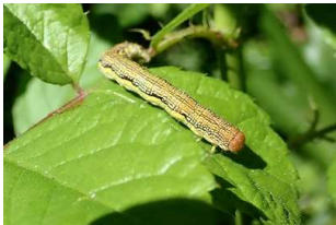
チャバネフユエダシャク・幼態