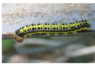
サカハチトガリバ・幼態