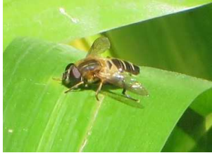
ヒゲブトハナムグリ