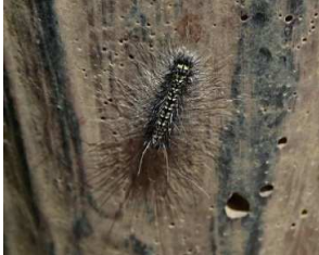
サカハチトガリバ・幼態