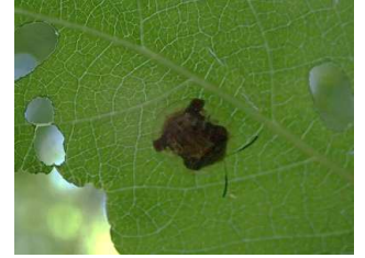
シロシタホタルガ・幼態