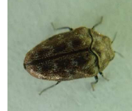
ブドウサルハムシ