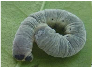
チャバネフユエダシャク・幼態