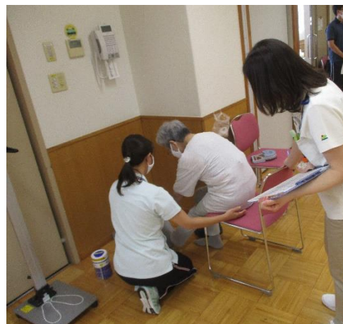
R3年度における体力測定の様子