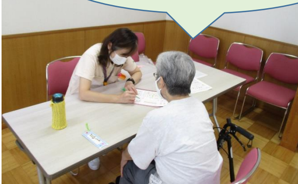
R3年度における専門職と面談の様子