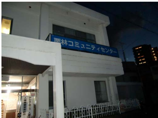
栗林コミュニティセンター