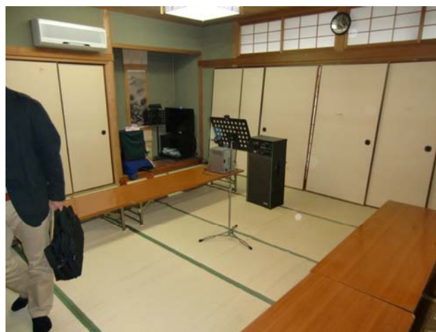
一宮コミュニティセンター