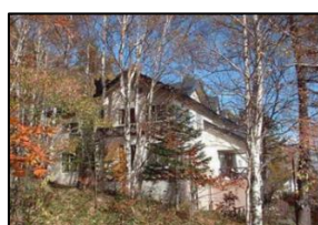
③. ペンション ぶちは一ぶ