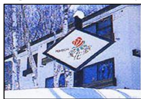
⑦. ペンション愛花夢