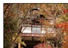
④. ペンション 八千穂山荘