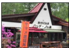
①. ロッジ 八ヶ嶺