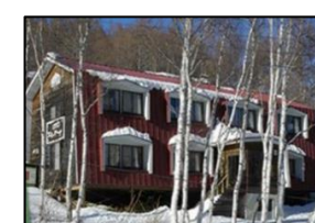
⑤. ロッジ エルケーナ