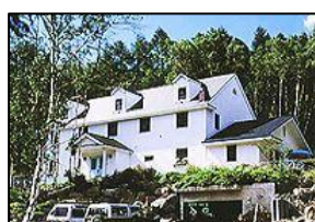
②. ペンション ラルゥ