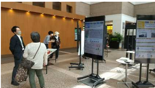
図 当日の様子（フォーリス）