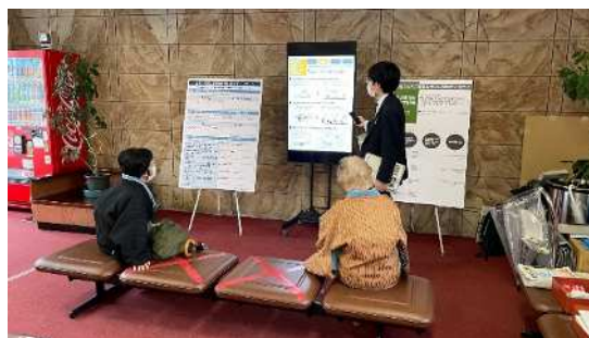
図 当日の様子（西府）