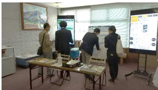
図 当日の様子（白糸台）