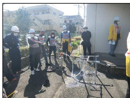
応急給水栓の設置