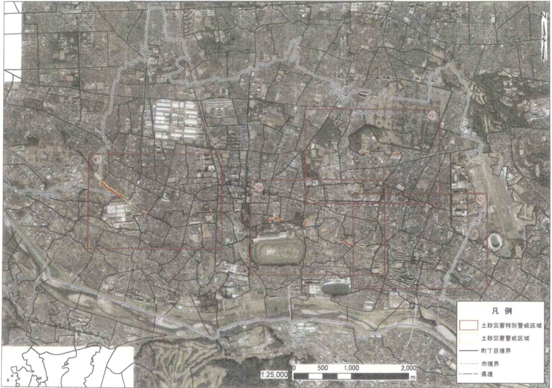
土砂災害警戒区域及び土砂災害特別警戒区域の拡大写真