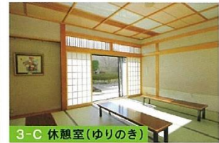
3-C 休憩室 (ゆりのき)