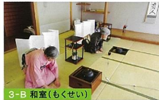
3-B 和室 (もくせい)