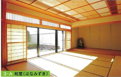
3-A 和室 (はなみずき)