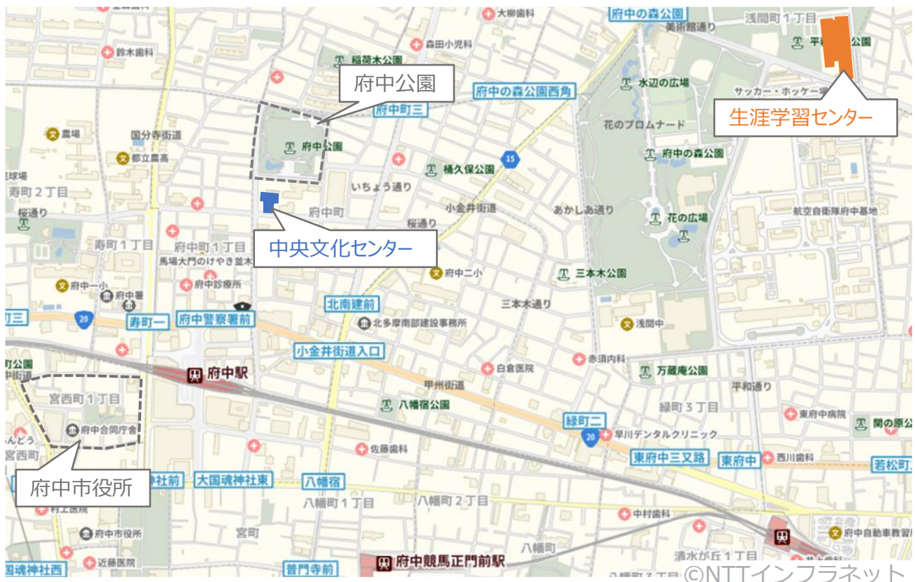
図1 生涯学習センターの位置

学習機能を交通利便性の良い府中駅周辺に移転するに当たり、移転の候補地として、生涯学習センターの学習機能と多く類似機能を有する中央文化センターが考えられます。 来年度に文化・スポーツ施設配置等適正化計画（仮称）を策定するにあたり、 中央文化センターとの補完・連携の可能性も合わせて検討する予定 です。