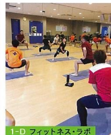
1-D フィットネス・ラボ