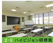
2-E ハイビジョン研修室