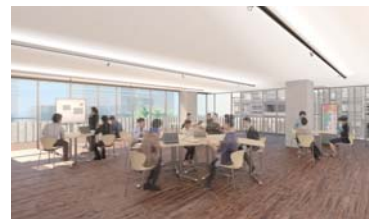
はなれ2階 市民協働ラウンジ