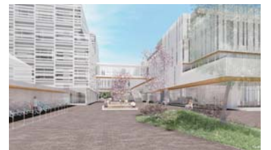
府中街道側から見た通り庭