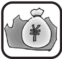
市の予算 市民1人当たり 370,414円