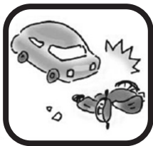
交通人身事故 1日に1.1件