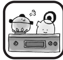
ガス使用料 1日1世帯1.80m 3