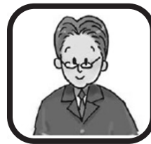
市職員 職員1人当たり 市民203人