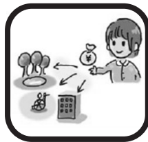
市税 市民1人当たり 197,250円