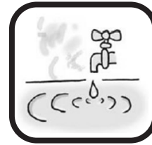
水道 1日1人0.27m 3