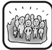
人口密度 1km 2 に8,767人