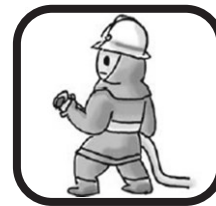
消防職員 職員1人当たり 市民860人