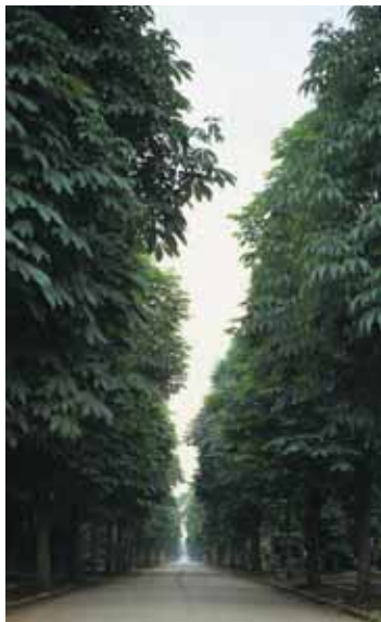
多磨霊園のトチノキ並木