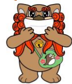
ふぢぢま 府中市マスコットキャラクター