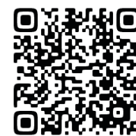
▲市ホームページのQRコード

府中市ホームページ、文化センター等の市の施設で配布する「ワクチンニュース」、広報ふちゅう、府中市メール配信サービス等で確認、または、府中市新型コロナワクチンコールセンターにお問い合わせください。(※全戸配布は「ワクチンニュース第1号」のみになります。)