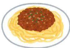
ミートソーススパゲッティ（主食・主菜）