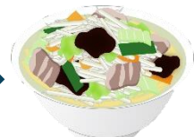
タンメン（主食・主菜・副菜）