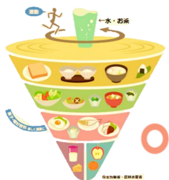
バランスの良い例