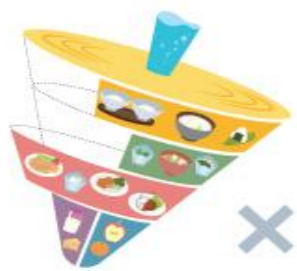
バランスの悪い例 (主食と副菜が欠けて、主菜が多すぎる例)

「健康のために1日に何をどれだけ食べたらよいか」をコマの形で表しています。食事は 主食(ご飯・パン・麺類など) 、 主菜(肉・魚・大豆製品・卵など) 、 副菜(野菜類・きのこ類・海藻類など) を基本に、 乳製品 や 果物 も取り入れていきましょう。