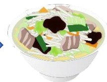
野菜たっぷりラーメン