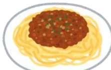
ミートソーススパゲッティ (主食・主菜)