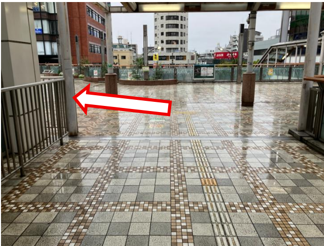
③ペデストリアンデッキに出たらすぐ左へ