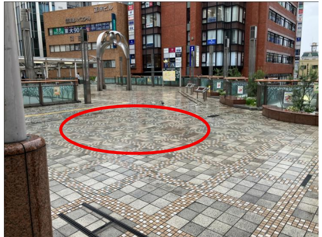
④枠のあたりが集合・解散場所です