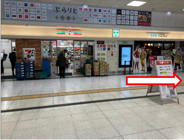
①府中駅北口改札を出たら右へ