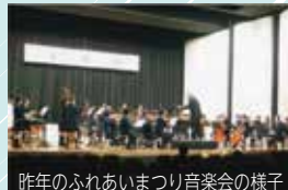
昨年のふれあいまつり音楽会の様子

11月5日(土) 12:30開演・13:00開演 明星学苑児玉九十記念講堂 今年も明星学苑の講堂をお借りして、盛大に行います。ふちゅこま、ひばピーもくるよ。みんなきてねー!!