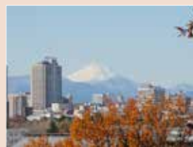
▲浅間山から見える富士山