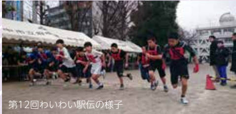
第12回わいわい駅伝の様子

12月23日(祝) 8:50~13:00 府中第一中学校 5人1組の駅伝競走(小学生の部・中学生の部・一般の部) 参加対象:第一中学校区内在住・在勤