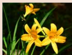
▲浅間山にだけ自生する珍しいユリ科の植物、ムサシノキスゲ

浅間山は、標高80メートルほどの小高い丘で、丘の頂からは府中市一帯や富士山を望むことができ、関東の富士見百景にも選ばれています。5月中旬になると、浅間山を唯一の自生地とするムサシノキスゲの黄色い花が見ごろの時期になります。府中市内で手軽に自然を満喫したい方にはおすすめのスポットです。