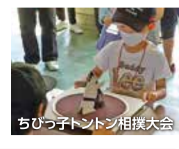
ちびっ子トントン相撲大会

例年は、住吉小と日新小にある土俵と四谷場所の時は簡易土俵を借り、そこで学年別・男女別で住吉・四谷・日新の3校の児童で取組をしますが、コロナ禍で取組ができず、参加者児童の各自が、厚紙でアバター力士を作り、委員長力作の土俵で対戦。校長先生とも対戦ができて、大盛況でした。