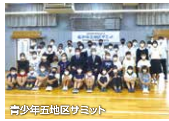
青少年五地区サミット

五中・六小・新町小・明星中学の児童生徒と保護者・青少対委員と各校教職員が一同に集まり、パネルディスカッションで児童生徒と交流しました。「ふるさと府中の将来について考えよう」をテーマに意見を出し合い、子どもたちからは、公共施設の利用時間延長や大人との交流が少ないので全世代が楽しめる府中にしたいなどの積極的な意見がありました。