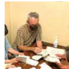
標語コンクール作品選別

写真は市で募集した標語コンクールを讀ませていただいている様子です。子どもの発想する可愛いイラストから、うまいと声のでる標語など委員で話をしながらも真剣に選ばせていただきました。