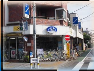
サイクルショップ セキ