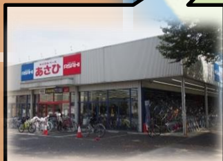
サイクルベース あさひ府中店