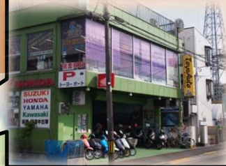
トヨタオート サービス