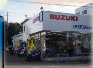
二輪ススキ ワールド多摩