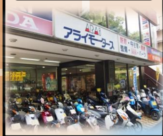
アライモーターズ 府中店