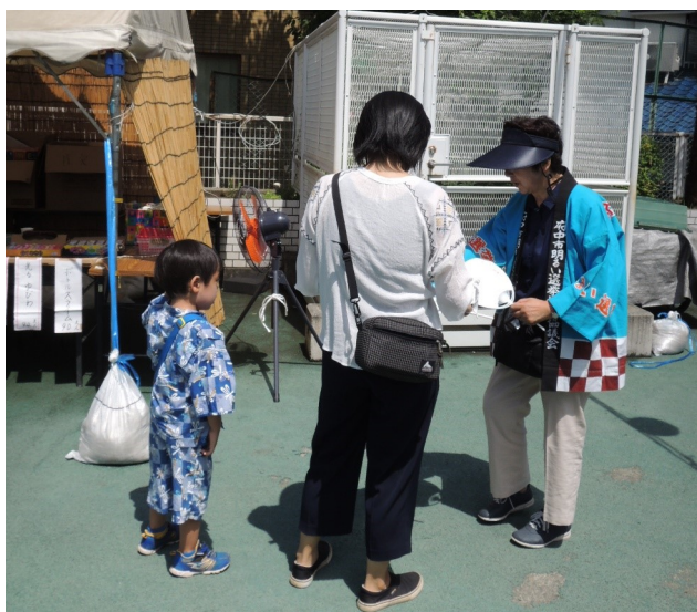
▲片町ブロックでの啓発風景

7月13日(土)・14日(日)と27日(土)・28日(日)に、市内11か所の文化センターで開催された文化センターまつりの会場において、各ブロックの推進委員による啓発活動を行いました。