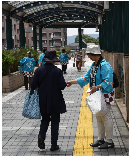
▲府中駅南口での啓発の様子

明るい選挙推進協議会・推進委員会では、7月18日（木）に、午前の部・午後の部に分け、府中駅周辺での街頭啓発を啓発活動を実施しました。