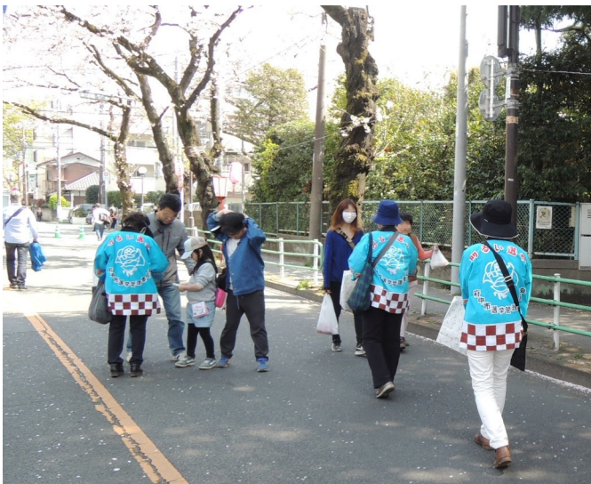
▲桜まつりでの啓発活動

明るい選挙推進協議会・推進委員会では、4月6日(土)に、市民桜まつりの会場やさくら通りなどで啓発活動を実施し、ポケットティッシュを配りながら、市議会議員選挙への投票参加を呼びかけました。