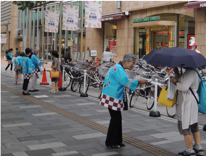
▲フォーリス前での啓発の様子

午後は小雨の降る中でありましたが、ポケットティッシュ、ウエットティッシュなどを配りながら、市民の方へ投票参加を呼びかけました。