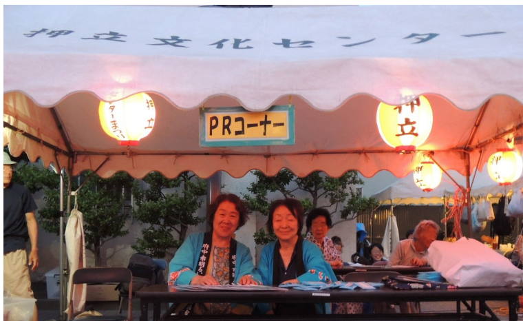
▲押立ブロックでの啓発風景

参議院議員選挙前後の日程となり、忙しい中での啓発となりましたが、各ブロックの推進委員は、来場者に、うちわとウェットティッシュを配布し、寄附禁止の3ない「贈らない・求めない・受け取らない」を呼びかけたり、「すっきり音頭」を披露し啓発を呼び掛けました。