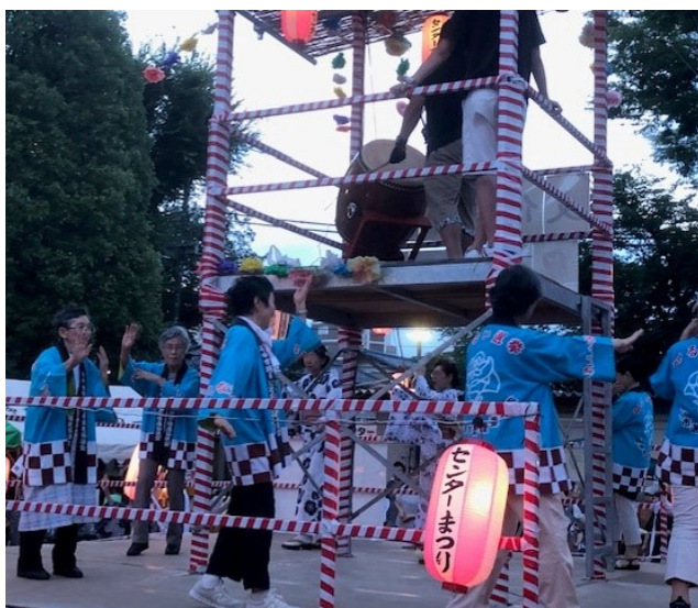
▲中央ブロックでの啓発風景