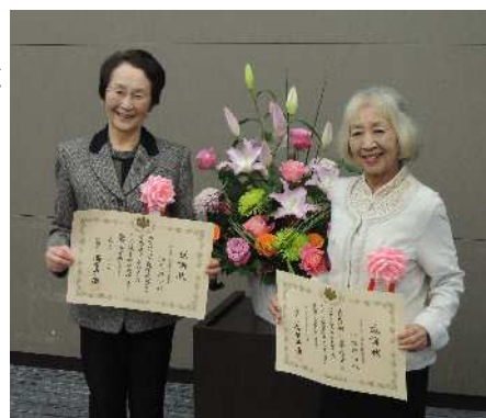
写真左から河内委員、小瀧委員