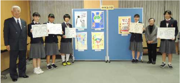
中学生の部の受賞された皆さま