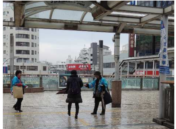
府中駅北口での啓発活動

明るい選挙推進協議会・推進委員会では、1月23日(木)には、午前の部・午後の部に分け、府中駅周辺で街頭啓発を実施しました。午後の部には、私立明星高等学校の生徒も参加し、有権者に投票参加を呼びかけました。