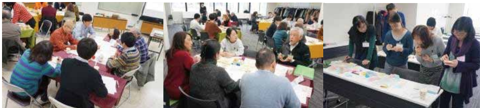
グループを移動しながらたくさんの参加者と話します