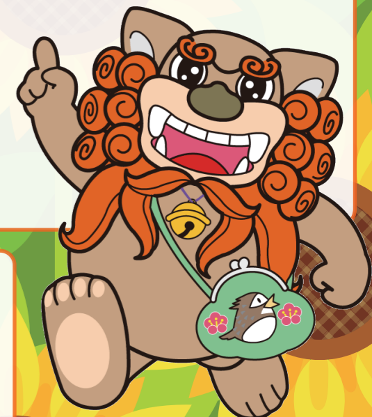
府中市マスコットキャラクター

消費者庁 http://www.caa.go.jp/foods/index.html