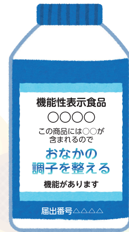
パッケージのイメージ