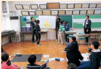
▲発表の様子(小学校)

各班3分程度で、議論した内容を発表しました。各班とも、自分達の想いを熱心に語り、児童・生徒の自由な発想力と提案が示されました。