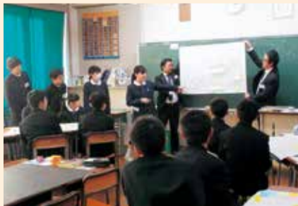
▲発表の様子(中学校)