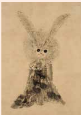
▲徳川家光《兎図》(部分) 個人蔵