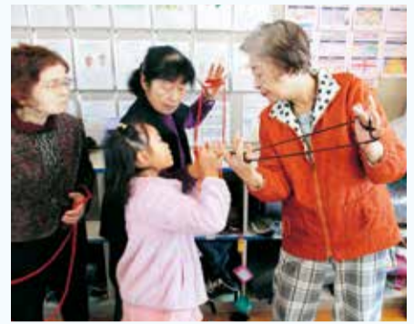
▲昔遊び交流会の様子

府中第四小学校は、145周年を迎えました。多磨っ子教育の会(スクール・コミュニティ協議会)が中心となり、児童の健全育成のため保護者・地域の皆様と共に安心・安全な学校を目指しています。年3回のコミュニティ協議会、道徳授業地区公開講座など保護者・地域の方と教職員とで意見交流を行い、学校の情報を共有、授業の質向上だけでなく相互理解や信頼を深めています。昔遊び交流会では地域敬老会の方々48名の先生をお招きし、昔の遊びを習い、交流給食で心が温くなる時間を過ごすことができました。田植えや保育園との交流会など地域とのつながりを一層深めていきます。