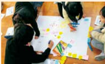
▲グループ作業の様子(小学校)

児童・生徒たちは、普段の学校生活で感じる学校施設の現状や要望について話し合い、どのようにすればもっと良い場所になるかを、限られた時間の中で試行錯誤しながら幅広くアイデアを出し、模造紙にまとめました。模造紙には、付箋を貼り付けたり、レイアウト図を描いたり、絵・図等を用いて紙面いっぱいにカラフルに表現しました。