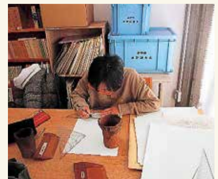
▲縄文土器の実測の様子 三角定規やコンパスを用いて土器を計測し、そのかたちを方眼紙に正確に書き写します。最近では3Dレーザーや写真撮影した画像から作図することもあります。