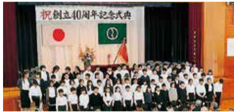
▲児童による呼びかけと歌

10月20日(土)、式典終了後には、6年生児童による呼びかけと合唱「COSMOS」を披露しました。呼びかけでは日新小のこれまでを振り返り、感謝の思いを伝えました。