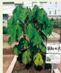
▲被爆樹木二世アオギリ (平成28年11月3日植樹)