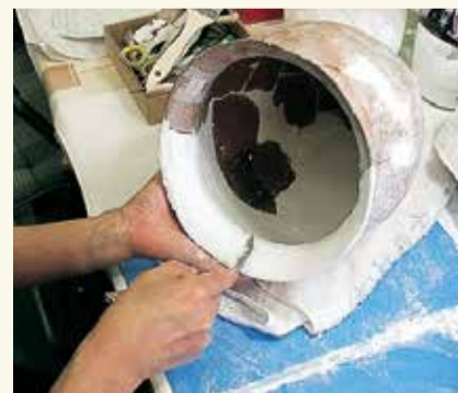
▲土器(土師器甕)の復元の様子 壊れて出土した土器の破片を接合した後、破片の足りない部分に石膏を流し込んで補強します。