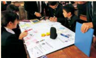
▲グループ作業の様子(中学校)