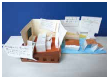
授業で作成した資料

府中第六小学校では残してほしいものとして、卒業制作のタイルや絵、桜やブロッコリーの木などがありました。改善点では教室や廊下を明るくする窓の開口、ロッカーや電子黒板の設置、トイレの洋式化などが挙げられました。また、校庭を芝生にすることや、遊具を増やすこと、体育館に空調設備を設置してほしいといった意見もありました。