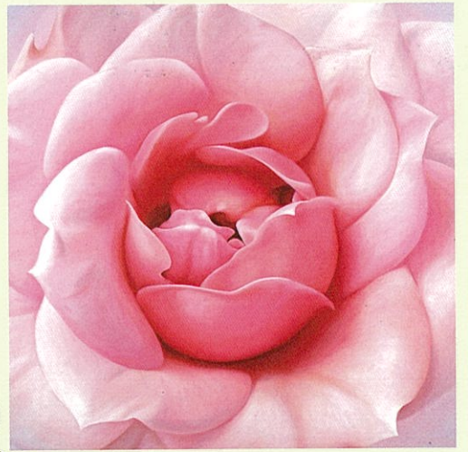
富田有紀子《719》2005年 当館蔵