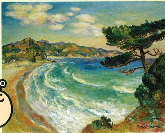
正宗得三郎《白浜の波》1938年頃 当館蔵