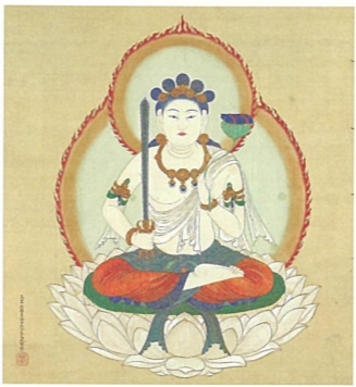
冷泉為恭 五髻文殊菩薩像 (後期展示)