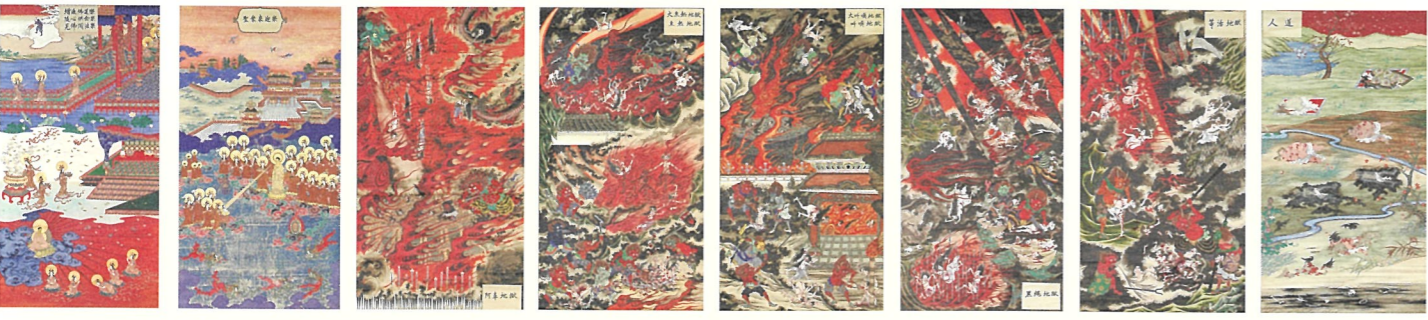
地獄極楽図 (18幅のうち) 金沢市・照円寺蔵 (後期展示)

死んだらどこへ行くのか？昔の人々にとっても、この問題は切実でした。誰もが行きたい「極楽浄土」、そして絶対に行きたくない「地獄」。二つの世界の様子は、經典に書かれています。しかし、文字だけではなく、目で確かめたい、という人々の気持ちからファンタスティックな浄土や、思わず目を背けたくなるような地獄の絵画を生み出しました。