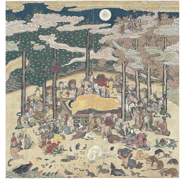
八相仏涅槃図 名古屋市・西来寺(後期展示)