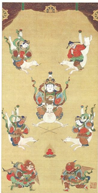
鈴木其一 茶祝尼天像 (前期展示)

平安・鎌倉時代に花開いた仏画。その完成された造形美は、のちの時代にも輝きを失うことのない「古典」として生き続けました。様々なスタイルの絵画が登場した江戸時代だからこそ、仏画の美しさに真摯に向き合う画家たちも大勢いました。古に学ぶことから生まれた、江戸時代の優れた仏画を紹介します。