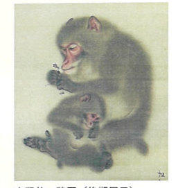
森狙仙 猿図(後期展示)