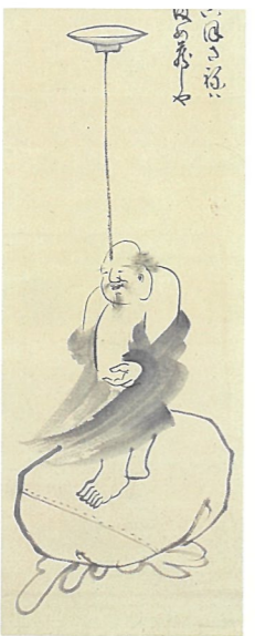
春叢紹珠 血回し布袋図 (後期展示)

観音さまに羅漢さん、寒山拾得、布袋さま。江戸時代には、真面目な信仰の対象であるはずの仏や人物が、いわばおかしなキャラクターにもなりました。「いかに変わっているか」を競う寒山拾得の絵や、絵の中で色々なことをさせられて「遊ばれる」布袋など、多彩で楽しい作品が、それぞれの仏や人物に備わる徳やその逸話から生まれています。