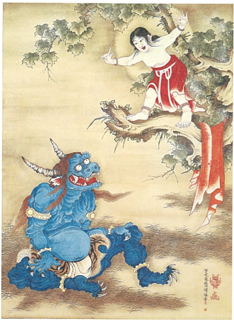
曾我蕭白 雪山童子図 松阪市・嵯峨寺 (後期展示)