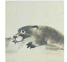
柴田義董 動物園押絵貼屏風 摘水軒記念文化振興財団(前期・後期展示)