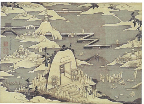
伊藤若冲 石峰寺図 京都国立博物館蔵 (前期展示)