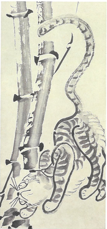
仙厓義梵 竹虎図 (後期展示)

江戸時代は禅宗が最も普及した時代で、その教えを伝えるための「禅画」も数多く描かれました。変な絵、かわいい絵、不気味な絵……。「常識を超えよ」と説く禅のスピリットを、おかしく、そして鋭く伝える作品の数々を見てみましょう。