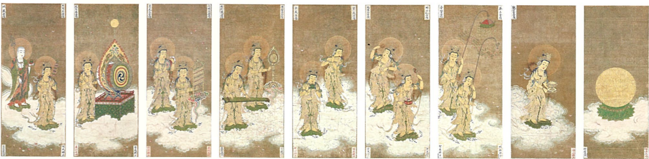
土佐行広 二十五菩薩来迎図 (17幅のうち) 重要美術品 京都市・二尊院蔵 (前期・後期展示)