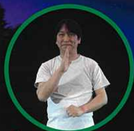
字幕・手話ビデオ付き