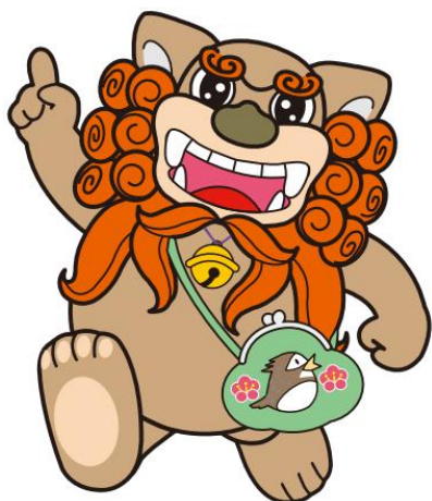
府中市マスコットキャラクター ふちゅこま

中学生が、学校から社会への移行のために必要な資質や能力を育む上で有効な学習の機会となっています。