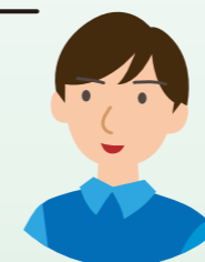
主任ケアマネジャー

地域包括支援センターは、市内に11か所あり、それぞれに担当する地区があります。詳細は次のページ