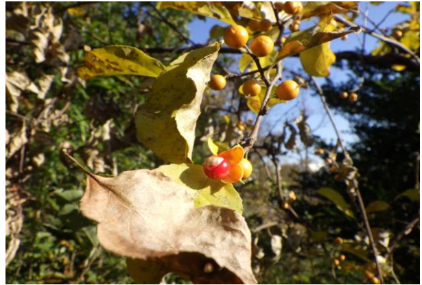
ツルウメモドキ 果実