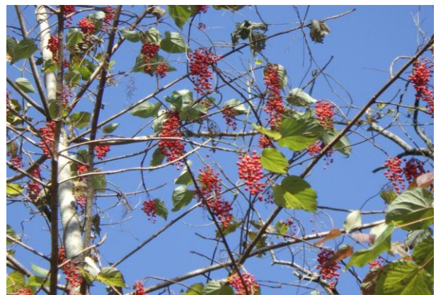
イイギリ 果実 雌雄異株 たまに雌雄が雑居することも