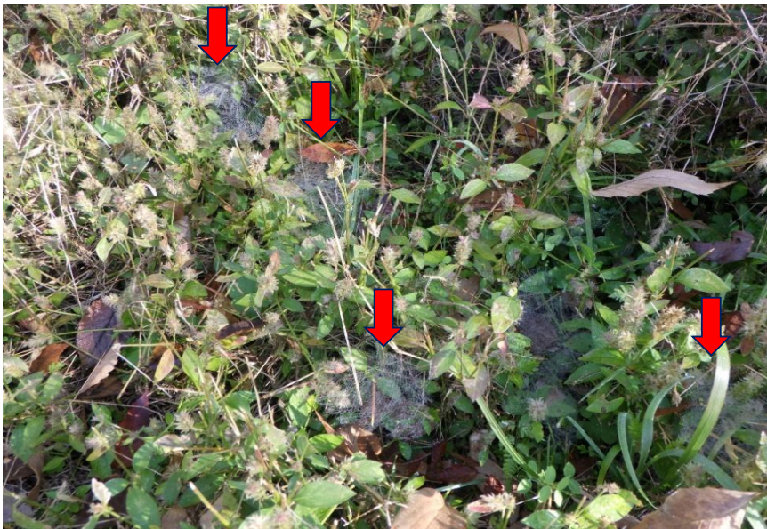
虫の越冬場所としてあえて高めに刈った草に多くのクモの巣が張られていました