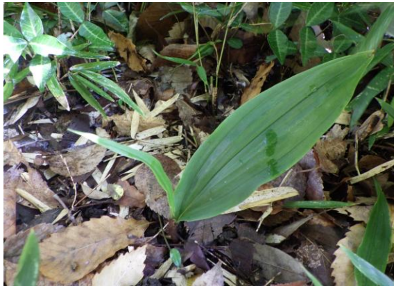
サイハイラン 秋に新しい葉を出します