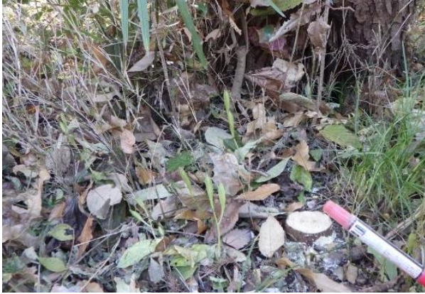
マヤランの生育地を新たに発見 5茎がまとまって生育していました

こまめに調査をし、毎月1回の自然環境調査では確認していない時期や箇所状況を記録しています。