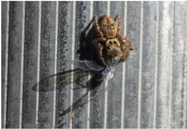
クモ 雪虫（アブラムシ）を捕まえている 大階段の下で確認