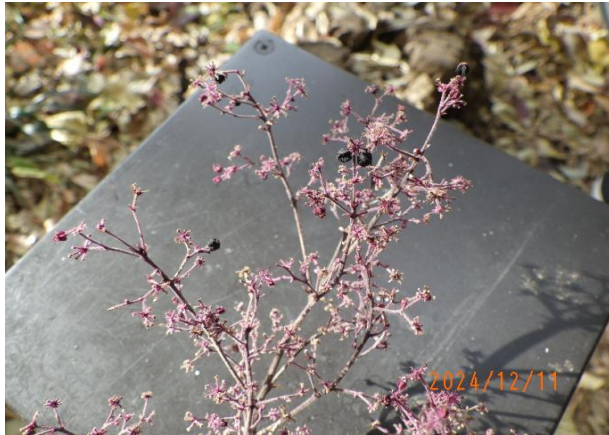
タラノキ 花柄 黒い実がついている

毎月1回開催される自然環境調査（植物班）に同行し、調査をしています。 調査日以外に見つけた生育場所・状況等については随時、情報提供をしています。 今月は、キチジョウソウやヤブコウジの生育場所について情報提供をしました。