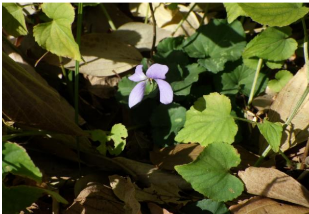
タチツボスミレの開花を今季初確認 (12月21日)