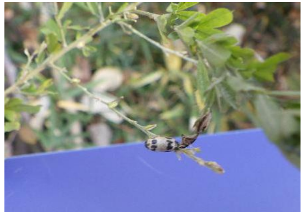
まゆ チビアメバチの一種のものと思われる 大階段の下で確認