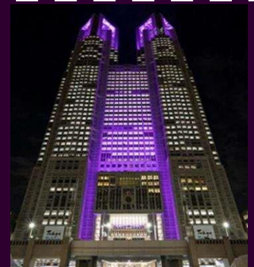
都庁のパープル・ライトアップ(2021年)

また、女性に対する暴力根絶のシンボルであるパープルリボンにちなんで、都庁などを紫色にライトアップする「パープル・ライトアップ」を実施しています。