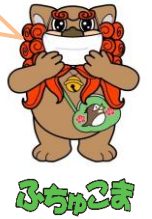
府中市マスコットキャラクター

都では、大規模接種会場を新たに4か所開設するとともに、既存会場における対象者を拡大しています。市でも保健センターで夜間接種を開設するなど、より多くの接種機会の確保に努めていますが、接種間隔の前倒しに伴う接種対象者増や、ワクチン供給量などの影響により、一時的に予約が取りづらくなる状況が想定されることから、可能な限り、以下の大規模接種会場での接種もご検討ください。