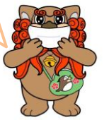
府中市マスコットキャラクター

3回目接種も引き続き接種できるこま 3回目接種も2回目接種した日から5か月以上経過した日から接種が可能になったこま