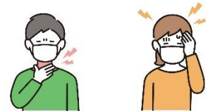
本人や同居家族に症状がある時

本人の意思に反してマスクの着脱を強いることがないよう、個人の主体的な判断が尊重されるように、お願いします。