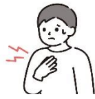
基礎疾患を有する方