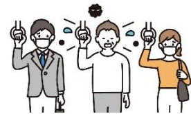
混雑した電車やバスに乗る時