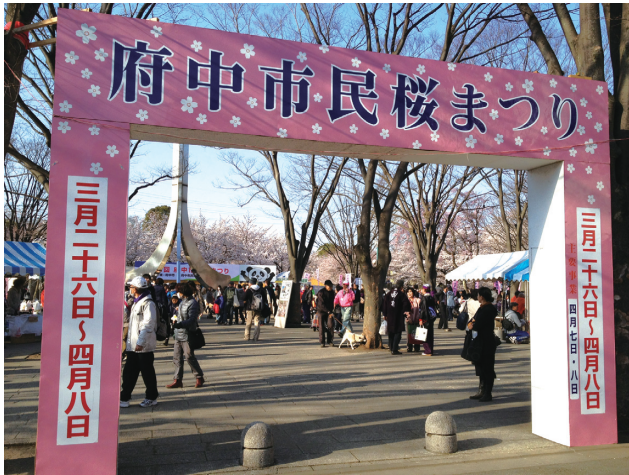
府中市民桜まつり