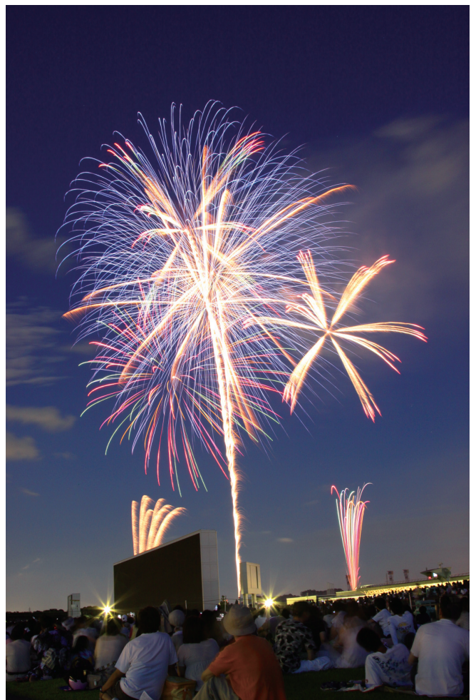
東京競馬場花火大会