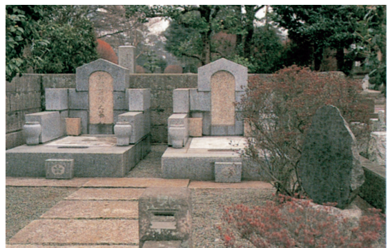
与謝野寛・晶子の墓

また、埋葬者ではないが、現代大衆小説を対象とした文学賞の一つである直木賞の由来となった直木三十五の追悼碑もある。