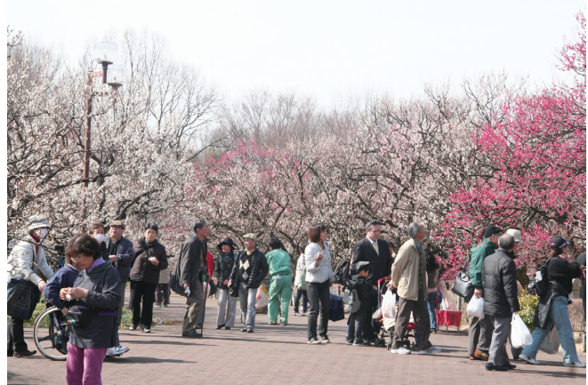
郷土の森の梅まつり