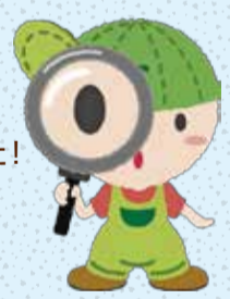
▲図書館キャラクター ぶっくん