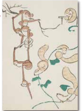
くわがたけいさい ちよっとうりかくがしき ▲ 鉄形 蕙斎(鳥獣略画式) 1797年 個人蔵

本展では、江戸時代の画家に入門したつもりで、描き方や、美しさの作り方の様々を見ていきます。絵を自分で描く人も、絵を見るのが好きな人も、より一層、江戸絵画の魅力の根幹に近づけるかもしれません。